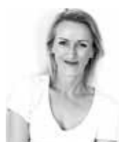
JOANNA KIRYŁOWICZ SIKORSKA & KIRYŁOWICZ ARCHITEKCI www.sikorska-kiryłowicz.pl

GDZIE KUPIĆ: zdjęcia – gallery4apartment.com; stół – IKEA; krzesła – allegro.pl; drewniane ręce – Reset